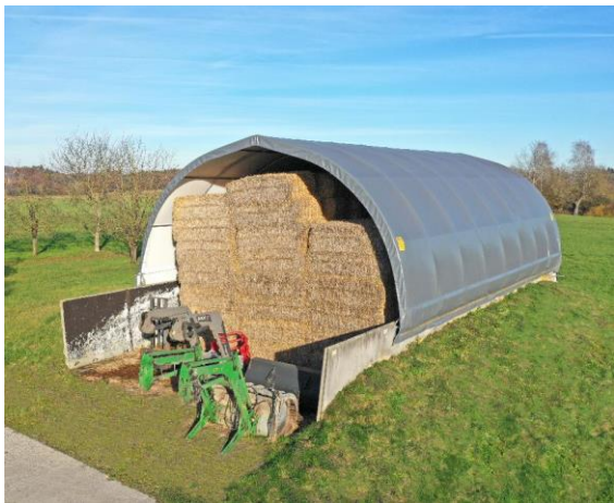
AGROTEL Rundbogenhalle als Heu- und Strohlager auf Silomauern befestigt.