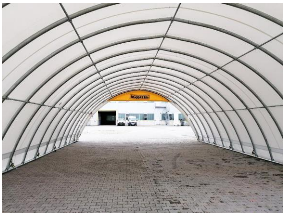
Innenansicht einer AGROTEL Rundbogenhalle mit weißer Plane.