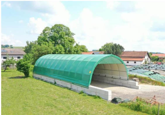
AGROTEL Rundbogenhalle auf Betonblocksteinen.